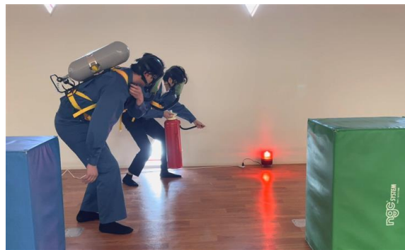
自蔵式呼吸具を使用した救助訓練