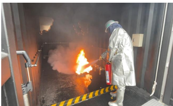
粉末消火器を使用した消火訓練