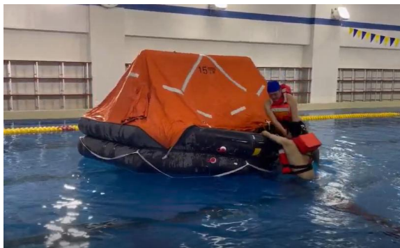
救命筏への乗り込み訓練